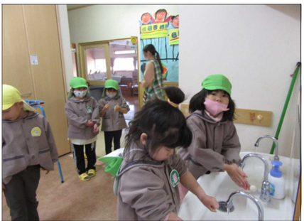
清潔でいられるようこまめに声をかけ手洗いの指導