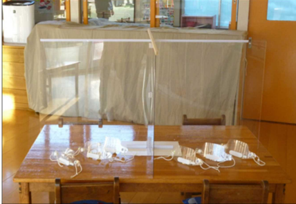
飛沫防止にマウスシールドや卓上パーティションを使用 少数体制でのワーク学習や活動を保障