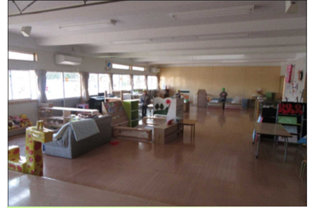
コーナーを広げるためにレイアウトを工夫して、密を防止