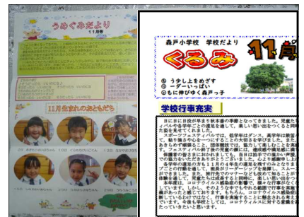
園便りと学校便りの交換による情報共有と連携

境町教育委員会としても、研修や参考になる情報・資料の提供を充実させていただき、円滑な接続を応援していきたいと思っております。