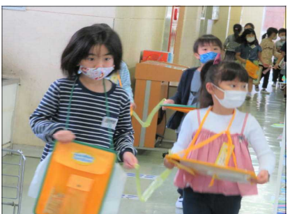
ひもで手をつないで、2年生が 案内し、学校の中を探検