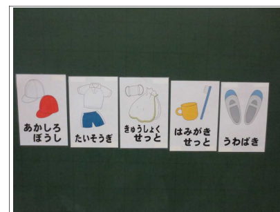
入学当初は絵を活用し、学習 用具名の理解を補助