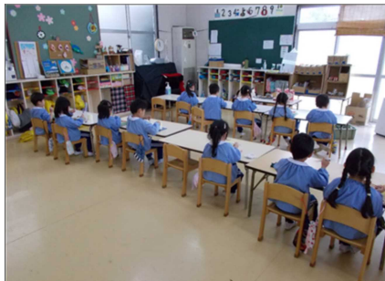
飛沫感染を防ぐため向かい合わせではなく、正面を向いて座り、集中して活動に取り組む習慣づくり