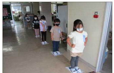
ソーシャルディスタンスの習慣