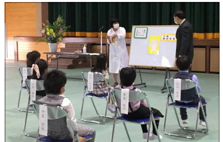
5月 既習を生かした新入生への 手洗いなどの指導