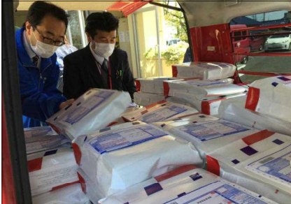
4月 臨時休業中の郵送による 新入生への教科書の配付