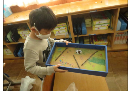
児童が作ったおもちゃを園児に遊んでもらう活動