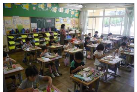
給食指導における配膳の補助に職員を増員、自分のエプロン等で衛生管理、前向きで黙って食事