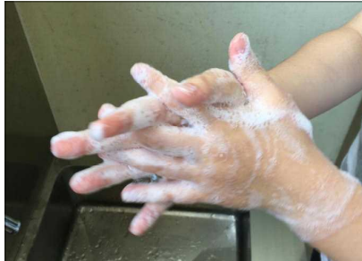
学校再開へ 各施設と学校の電話等による情報交換連携