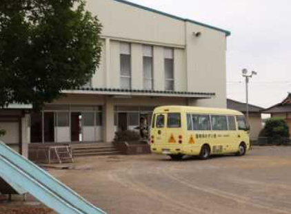
洪水を想定し園児をバスと徒歩で小学校の体育館へ避難訓練