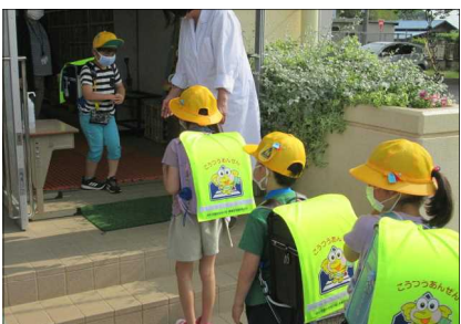
登校後の消毒や検温・健康チェックカード表等の提出