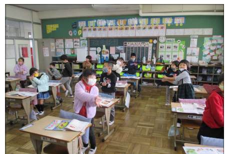
校歌の歌詞をジェスチャーで楽しく 覚える学習