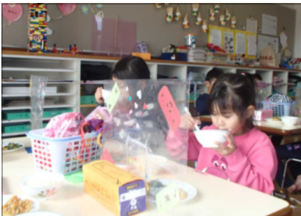
飛沫防止シールドの使用と時間を制限した食事の指導